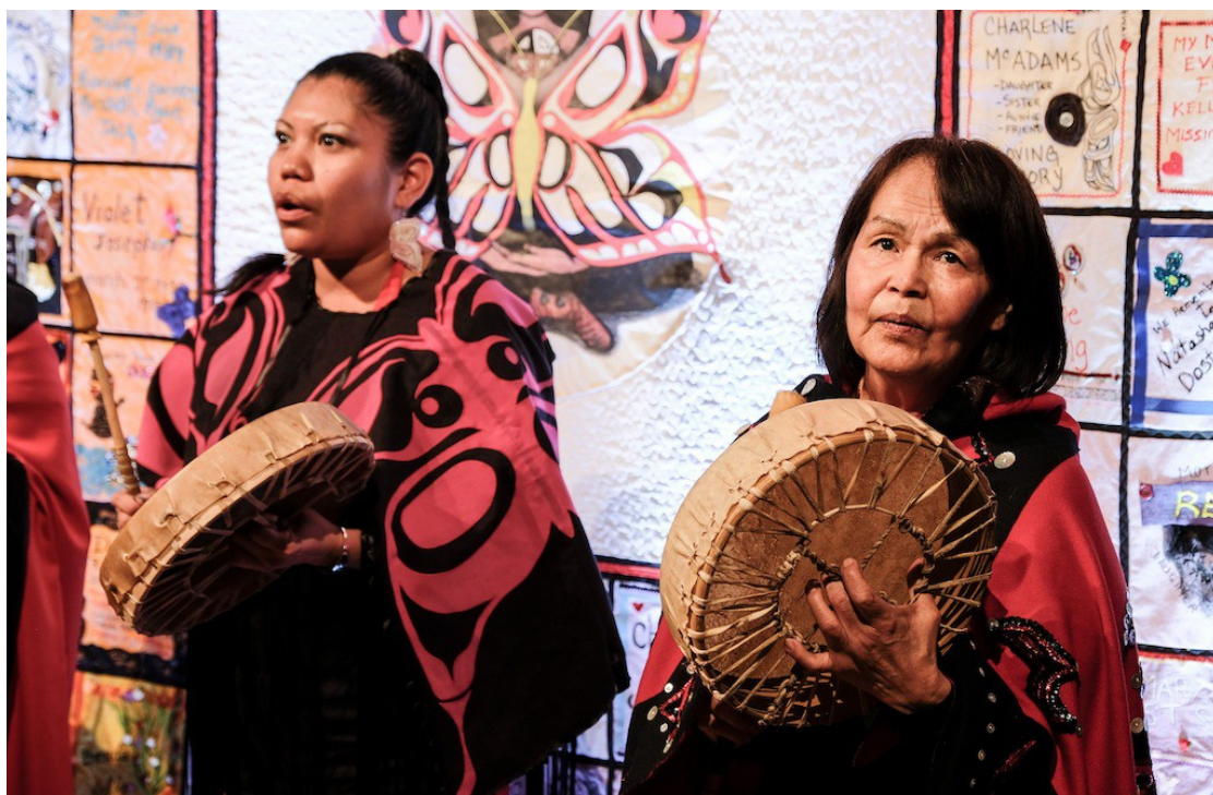
Cérémonie d'inauguration d'un patchwork géant tissé en l'honneur des femmes disparues, le 10 mai 2016 à Victoria