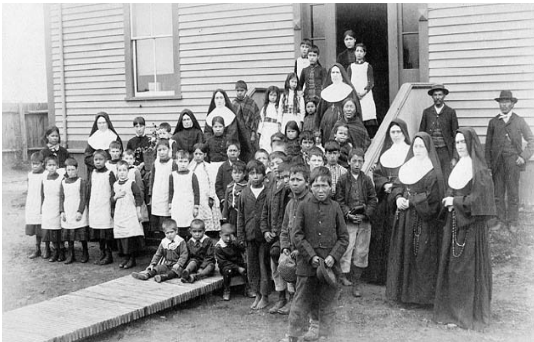
Port Harrison, Quebec, vers 1890