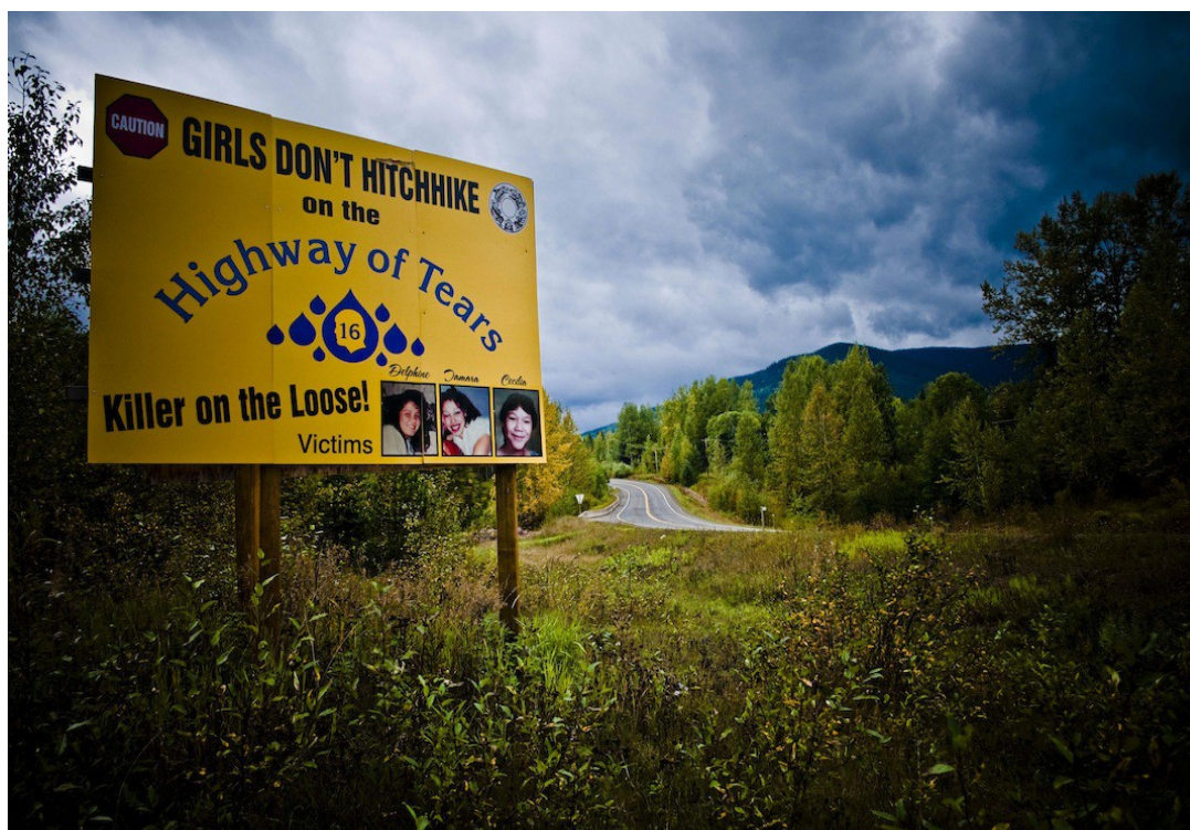
Un panneau de sensibilisation aux dangers de l'auto-stop sur l'autoroute des larmes (Highway of Tears), en Colombie-Britannique

Pour la Cour interaméricaine des droits de l'homme, le fait que 49% de ces victimes aient été tuées par des inconnus – taux largement plus élevé que pour le reste de la population canadienne où il n'est que de 23% – montre que les femmes autochtones sont plus à même d'être les proies de prédateurs sexuels, de serial killers et autres criminels 12 . Selon l'avocate et activiste mik'maq Pamela Palmater 13 , ce chiffre vient contredire l'idée reçue selon laquelle la violence conjugale serait inhérente aux familles autochtones. Stéréotype doublement infondé puisqu'il sous-entendrait que les autochtones ne se marient qu'entre eux, masquant par là-même le fait que les unions mixtes ont toujours été légion. En revanche, pour les familles de victimes, tout comme pour de nombreuses associations, le fait que les femmes autochtones soient davantage prises pour cible par des inconnus est directement lié à la vision de la femme héritée de l'époque coloniale : la femme autochtone est considérée comme un bien à posséder , qu'il faut soumettre, dominer et maîtriser. Symboliquement, elle représente également la culture autochtone tout entière qu'il convient d'éliminer pour devenir le maître incontesté d'un territoire nouvellement colonisé.