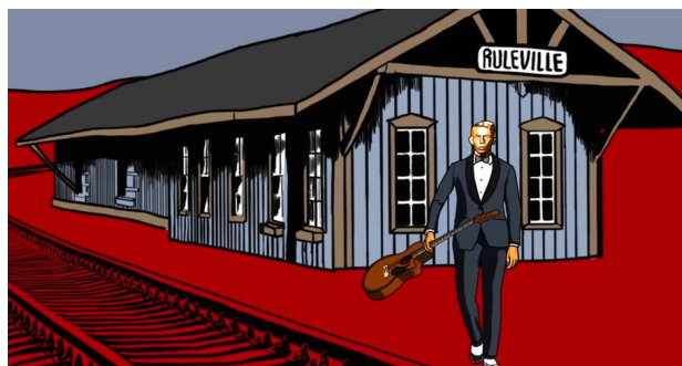
Quelques animations réalisées par Meky pour le film RUMBLE, The Indians who Rocked the World.